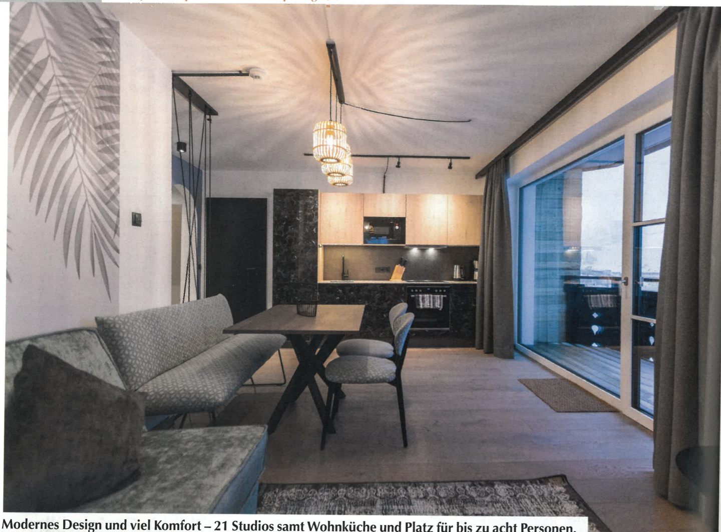
Modernes Design und viel Komfort – 21 Studios samt Wohnküche und Platz für bis zu acht Personen.