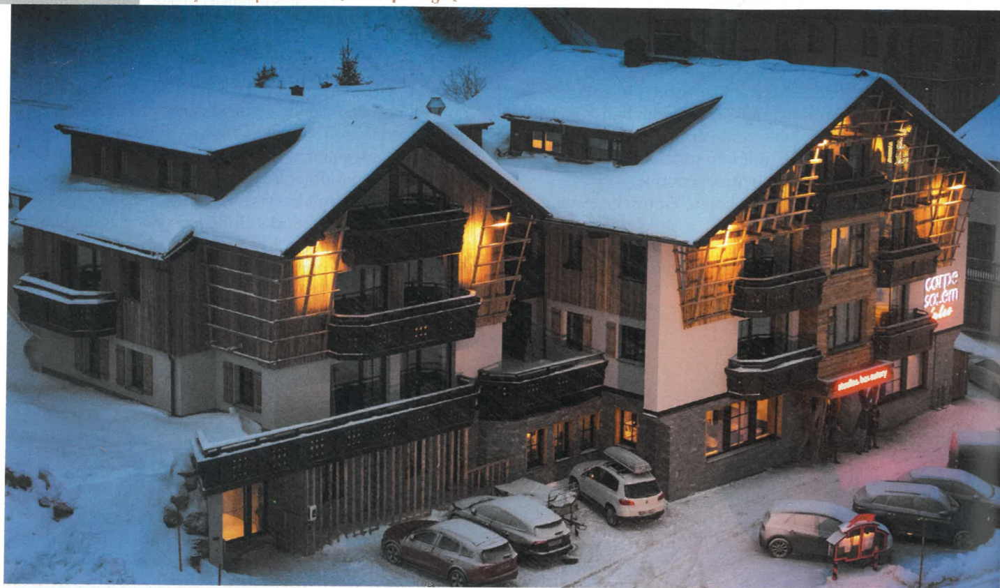
Apartmenturlaub individuell mit dem Service eines Hotels und Toplage gegenüber der Gondelbahn – Carpe Solem Jules.