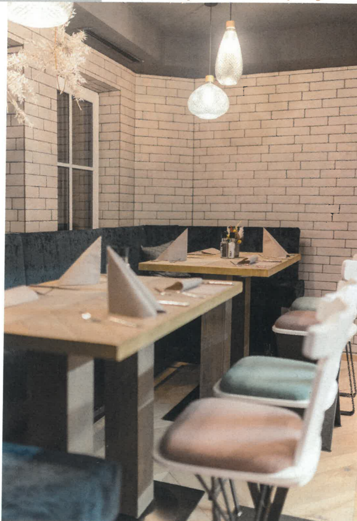
Stylische Homebase in Obertauern mit lässigem Ambiente.