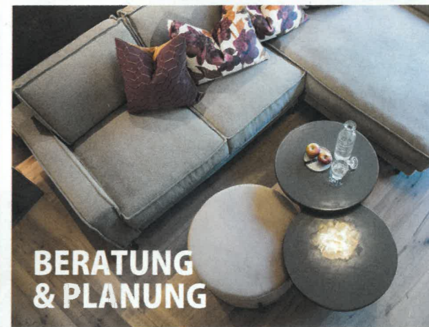
BERATUNG & PLANUNG