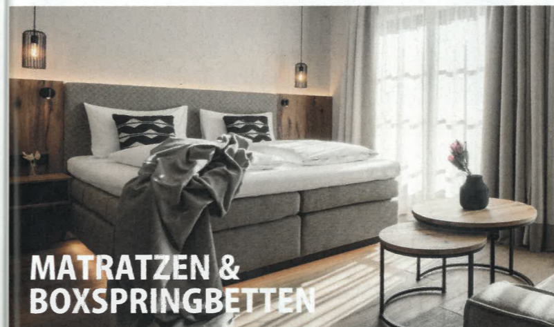
MATRATZEN & BOXSPRINGBETTEN